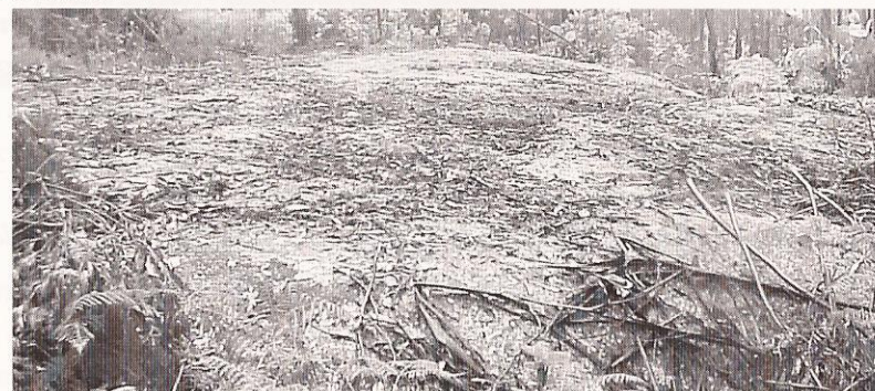
Pedra da liñaza

Cóntase que esta aparición ocorríalles ás “persoas retrasadas.”