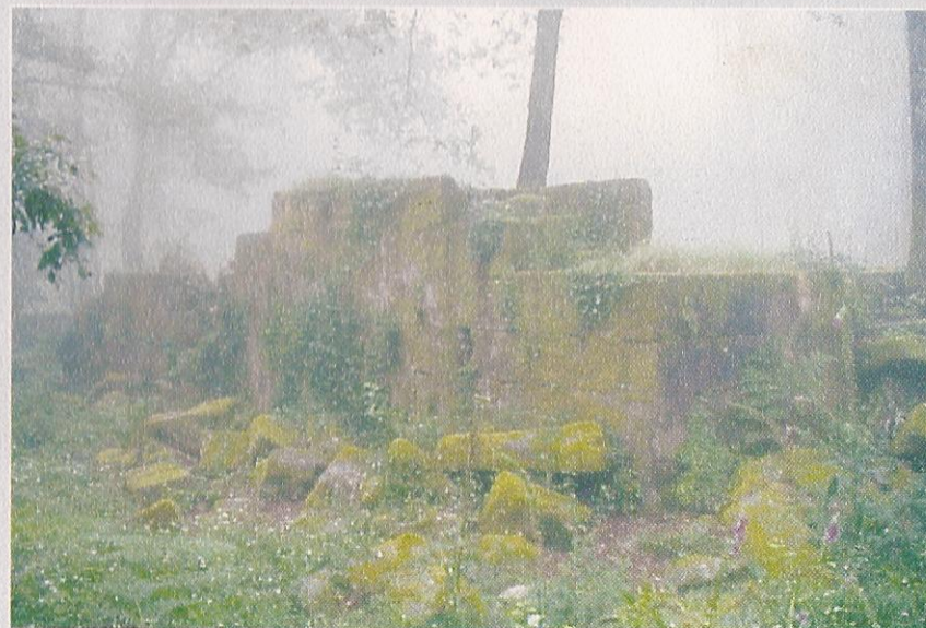
Ruínas da ermida de San Lourenzo