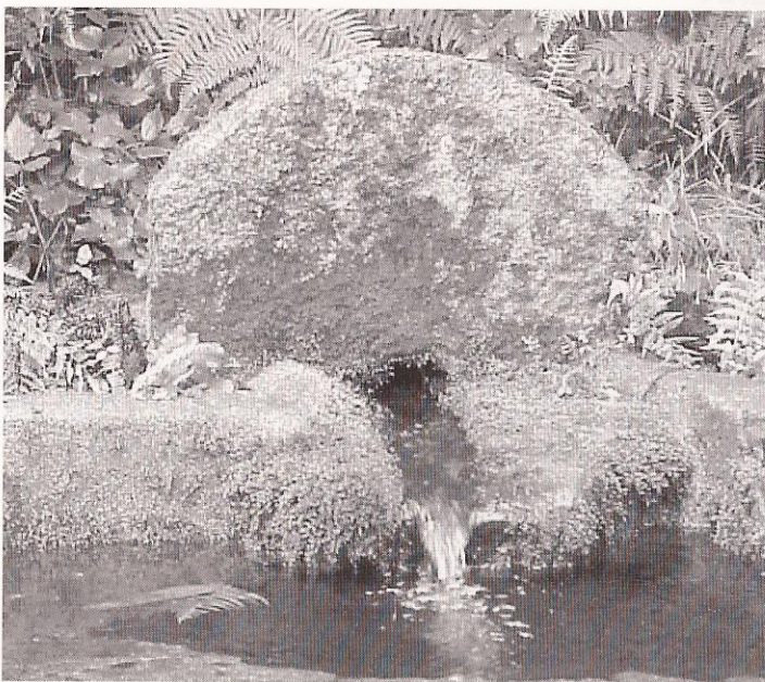
Imaxe actual da fonte de San Lourenzo.