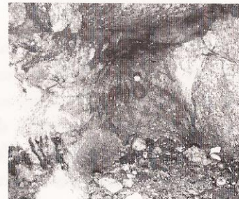
Estas dúas imaxes mostran o interior da cova do Xistro.